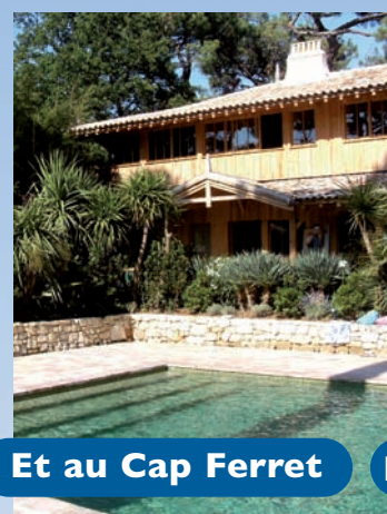
Et au Cap Ferret