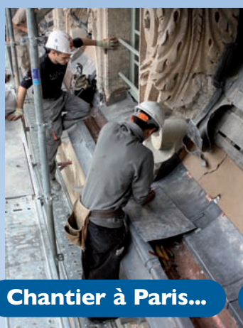
Chantier à Paris...